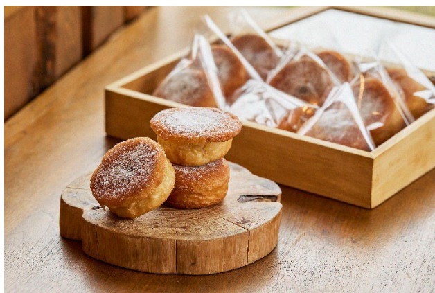
イメージ：シナモンブレッド