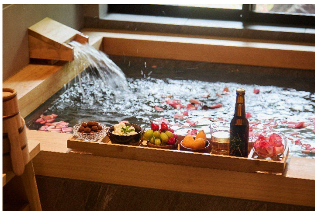
イメージ：Delivery to the Bath