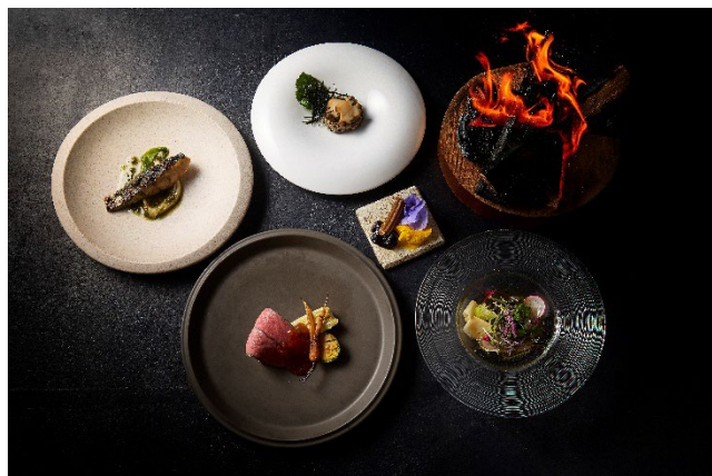
WOODSIDE dining 春コースメニュー

箱根リトリート före & villa 1/f（所在地: 神奈川県足柄下郡箱根町仙石原）は、春の新メニューとして、薪火料理「WOODSIDE dining」と料亭「俵石」にて、旬の食材をふんだんに使用した特別なコースの提供を 2025 年 3 月 3 日（月）から開始いたします。薪火を活かした調理法と季節の恵みを融合させたコースで、春の訪れを五感でお楽しみいただけます。