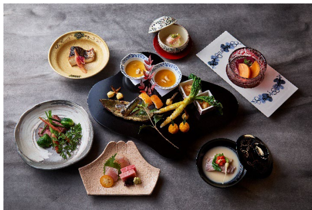
俵石 春コースメニュー