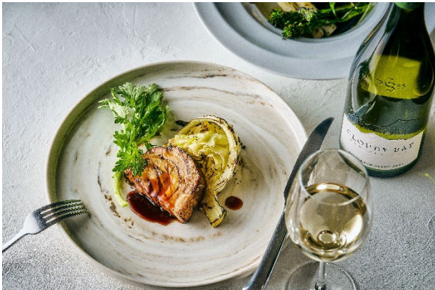
WOODSIDE dining 「Winter Course A」 (イメージ)

雄大な自然が息づく箱根・仙石原のフォレストリゾートホテル「箱根リトリート före & villa 1/f」（所在地：神奈川県足柄下郡箱根町仙石原）は、2026年3月16日より、春の息吹を五感で味わう新メニューの提供を開始いたします。薪火の力強い香りが素材を包み込む「WOODSIDE dining」と、歴史ある空間で繊細な技が光る料亭「俵石」。それぞれのレストランが、ホワイトアスパラガスや山菜、真鯛など、春の恵みをふんだんに取り入れたメニューで至福のひとつときをお届けします。