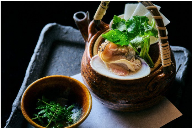
蛤どびんむし 独活 みつば 木の芽（イメージ）

大正時代の建築美が残る空間で、日本の春を慈しむ「花月の懐石」をご用意いたしました。前菜には、蓬（よもぎ）とうふや小鯛の桜すし、のびる、わらびといった春の野山を思わせる品々が並びます。蛤（はまぐり）のどびんむしが優しく胃を温め、焼肴には「あまだい柚香焼」、強肴には「黒毛和牛フィレ肉」を行者にんにくやごごみと共に。締めくくりには、御殿場産こしひかりと和牛時雨煮、そして桜羊羹の豆乳ソース添えが、箱根の春の余韻を鮮やかに彩ります。