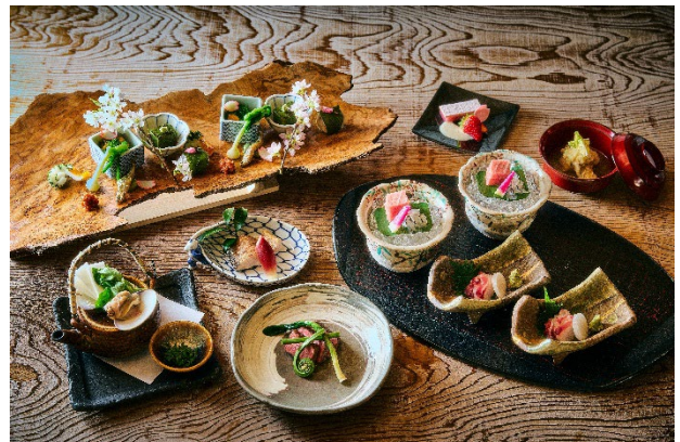
俵石「季節懐石」 (イメージ)